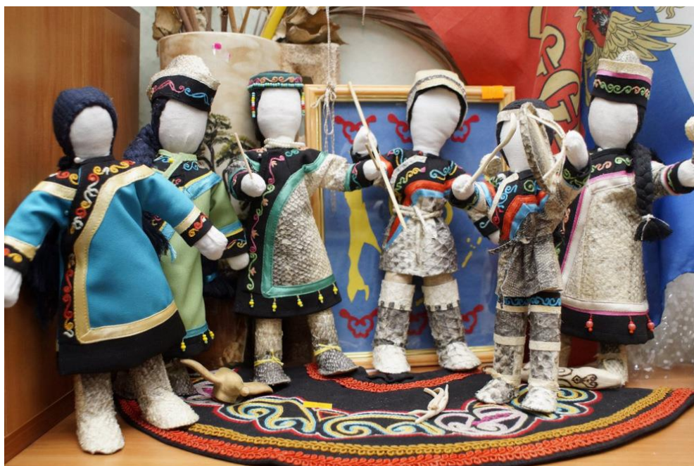
Примеры работ нивхской национальной куклы, Охинская организация «Кыхкых» («Лебедь»)