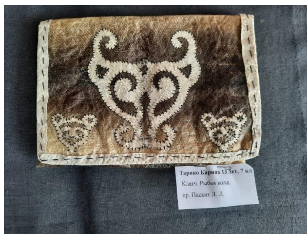
Тарико Карина 13 лет